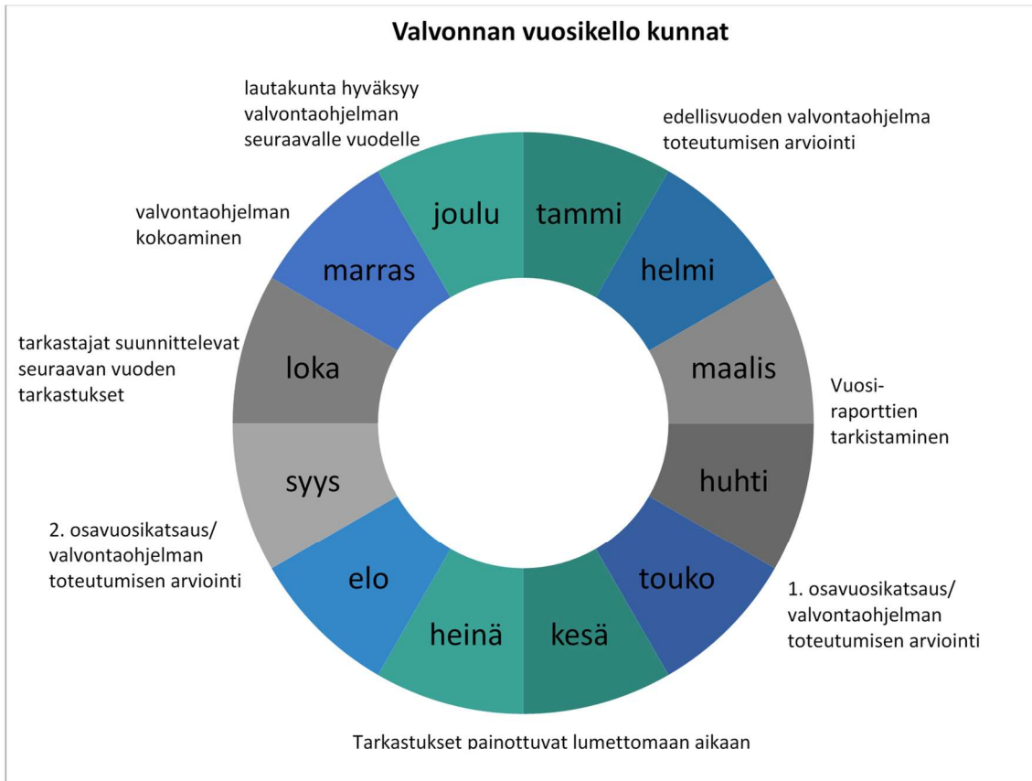
Kuva 2. Valvonnan vuosikellossa on esitetty valvonnansuunnittelun, toteuttamisen ja seurannan vuosittainen rytmitys.