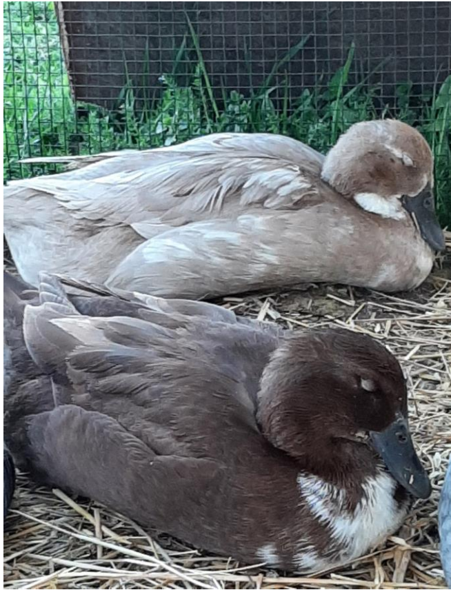
Latte ja Mymmeli