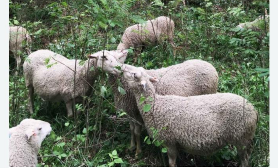
Jättipalsami maistuu lampaalle.