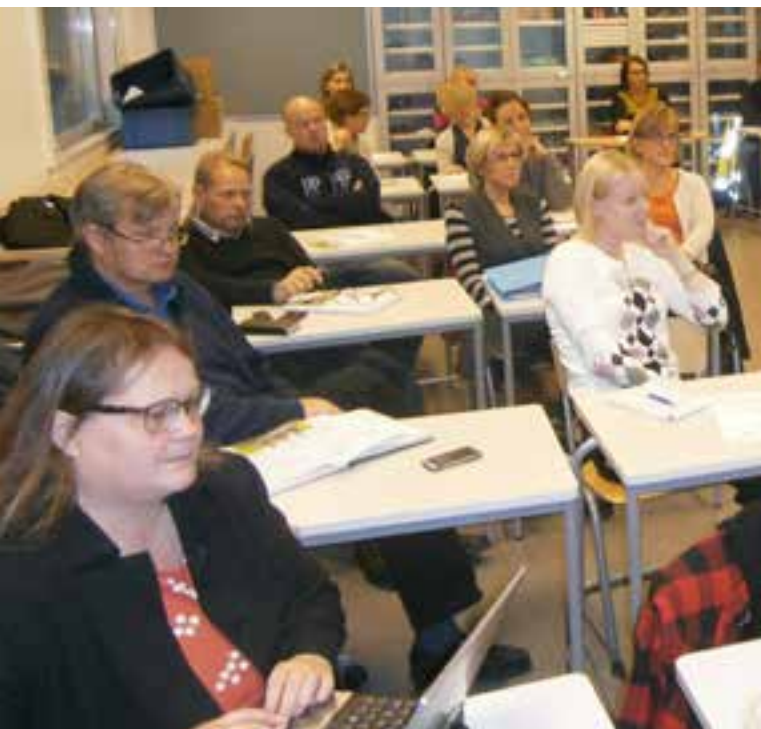
Ekotukihenkilöitä koulutetaan parantamaan oman työpaikkansa energia- ja materiaalitehokkuutta ja rakentamaan ekotukihenkilöiden välistä yhteistyötä. Koulutus aloitettiin lokakuussa.